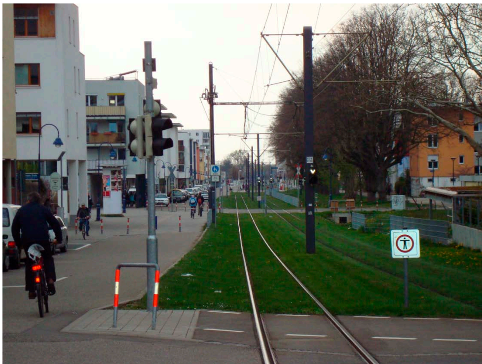
Figur A3 Et eksempel på restriktionerne for biltrafikken i Vauban (Freiburg), hvor der er opsat stelere, som kun lader cyklende og gående passere. Dette er med til at begrænse biltrafikken i området.