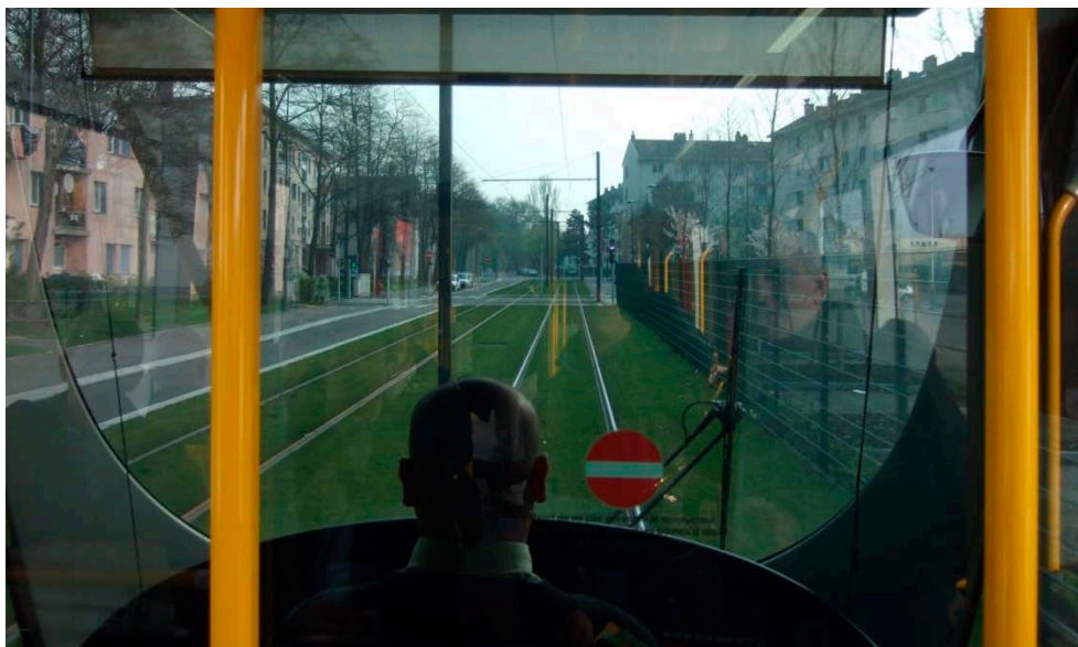
Figur B1 I Mulhouse har man valgt at føre en af de to linjer gennem et socialt belastet boligområde (til venstre på billedet).