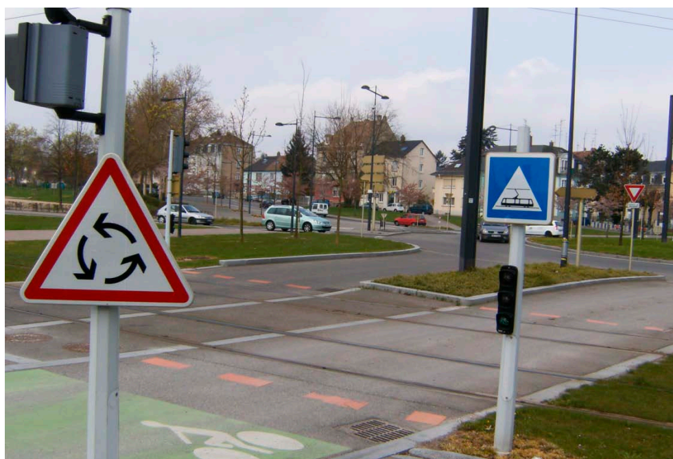
Figur C2 Skiltning af letbanen i et tilfartsspor til en rundkørsel i Mulhouse.