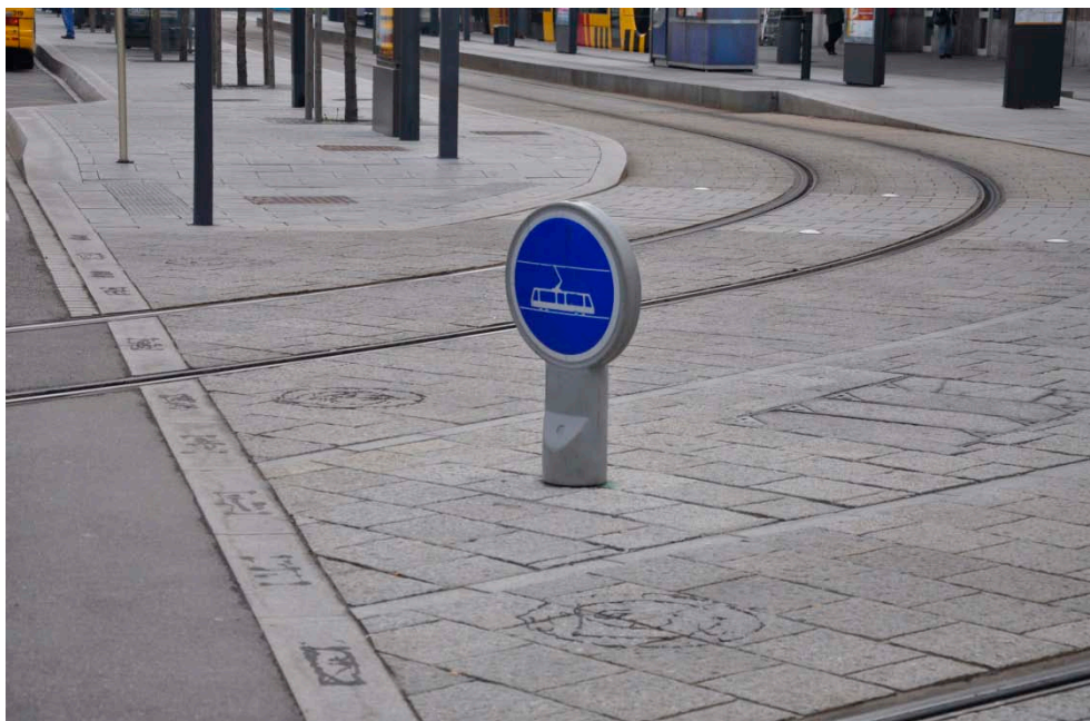
Figur C3 Et skilt gør trafikanterne opmærksomme på, at der kun må køre letbanetog i letbanetracéet foran banegården i Mulhouse.