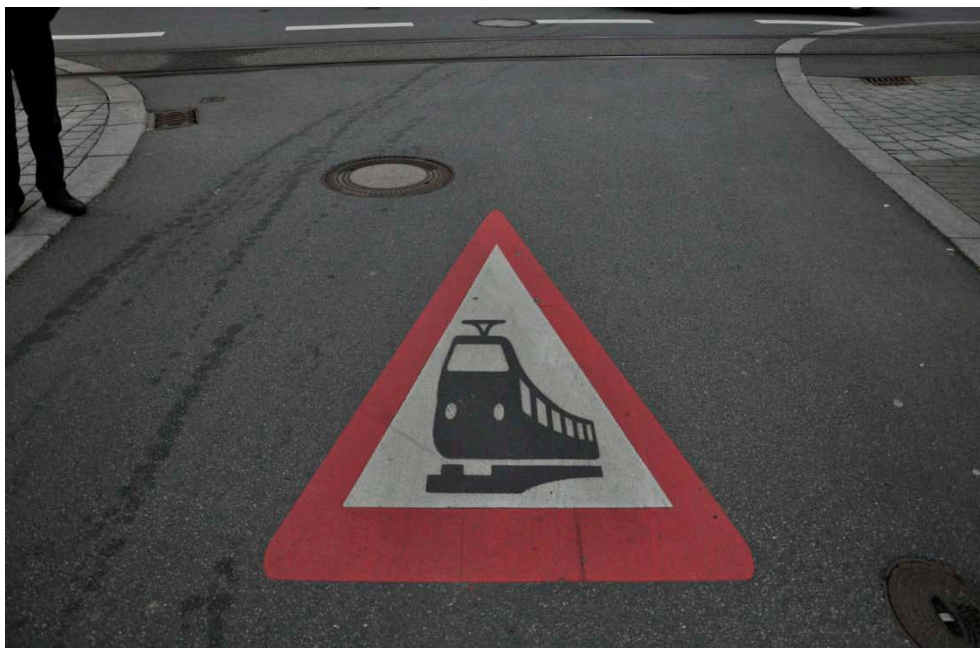
Figur C5 Letbanesymbol i afmærkningen på en sidevej til letbanen i Kirchheim.