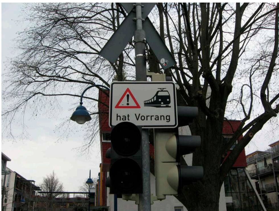
Figur C6 Et skilt indikerer, at letbanen har forkørselsret i Freiburg. Denne opprioritering af letbanen i forhold til især bilerne er med til at gøre letbanen mere konkurrencedygtig i forbindelse med borgernes transportmiddelvalg.