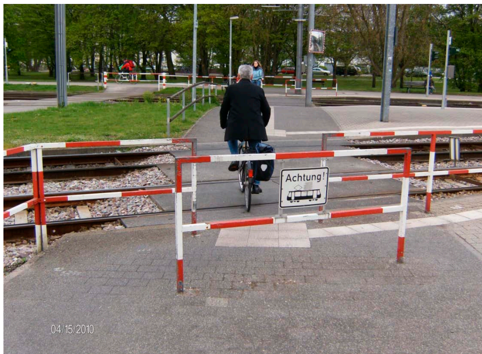
Figur C1 Skiltning af letbanen ved en krydsning for fodgængere og cyklister i Karlsruhe.