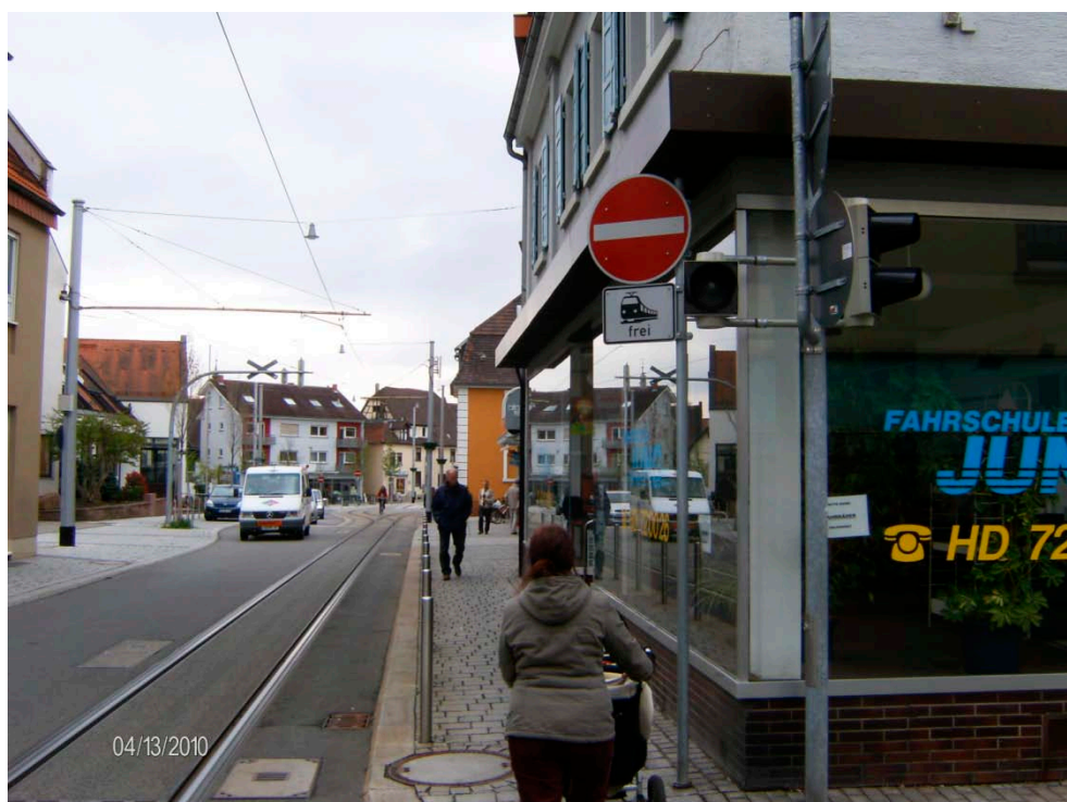
Figur C4 Forbudstavle mod kørsel med en undertavle, der undtager letbanetog. Fra Kirchheim.