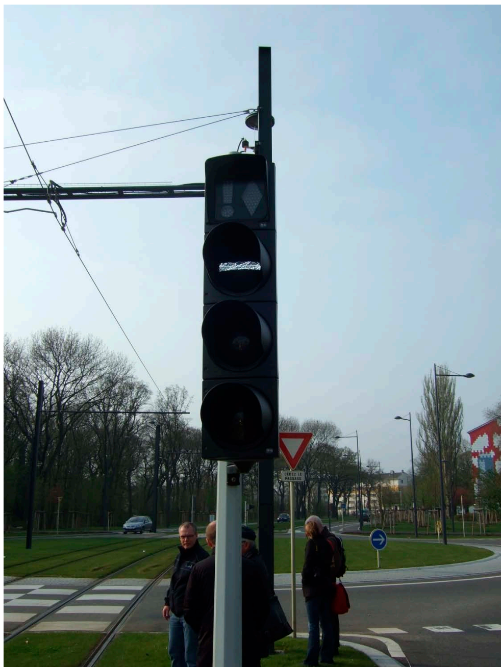
Figur A2 Et letbanesignal ved en rundkørsel i Mulhouse med stopsignal, forvarsling og grønt signal. Øverst på signalstanderen sidder et advarselssignal, der aktiveres for at advare togføreren om snarlig igangsætning.