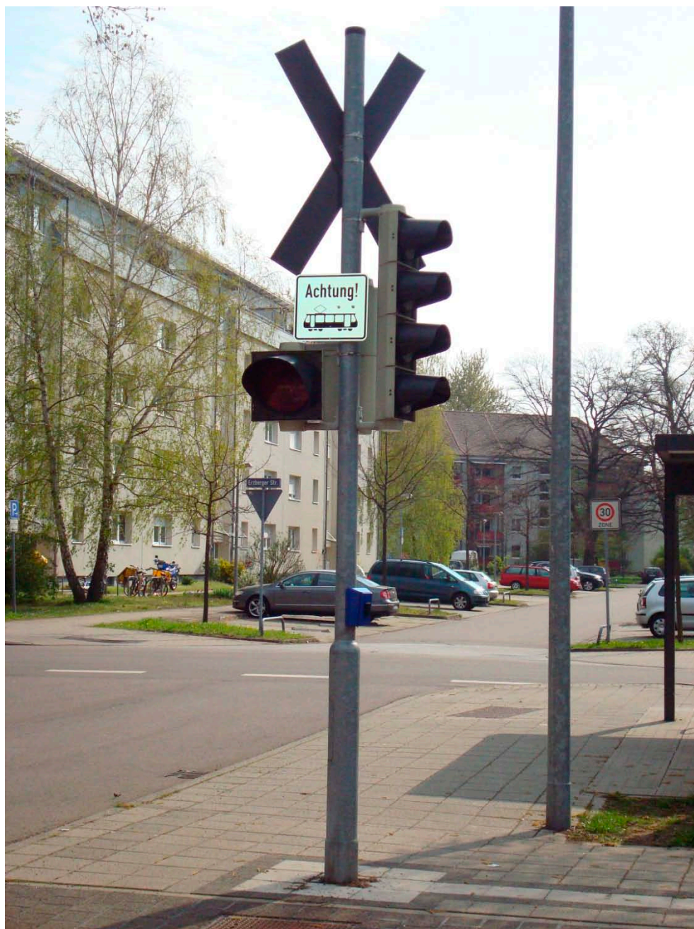
Figur C7 Skiltet er med til at gøre bilister og andre trafikanter opmærksom på letbanens kørsel i området, hvorved ulykker forebygges.