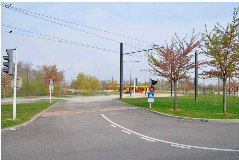
Figur B4 Letbanetoget har aktiveret et advarselssignal for biltrafikken ved krydsningen af letbanen. Fra Mulhouse.