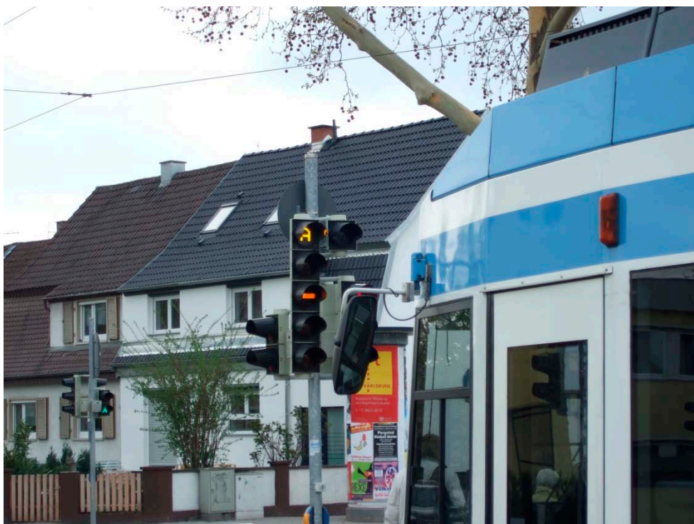
Figur A3 Et letbanesignal fra Heidelberg, hvor bjælkerne er røde i stedet for hvide, og hvor advarselssignalet er et "A" i stedet for et advarselssymbol.