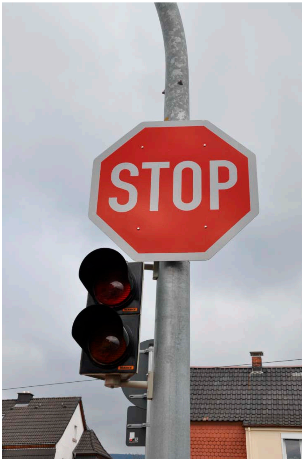
Figur B1 Stopsignal på en sidevej til letbanetracéet i Kirchheim, som aktiveres af letbanetoget.