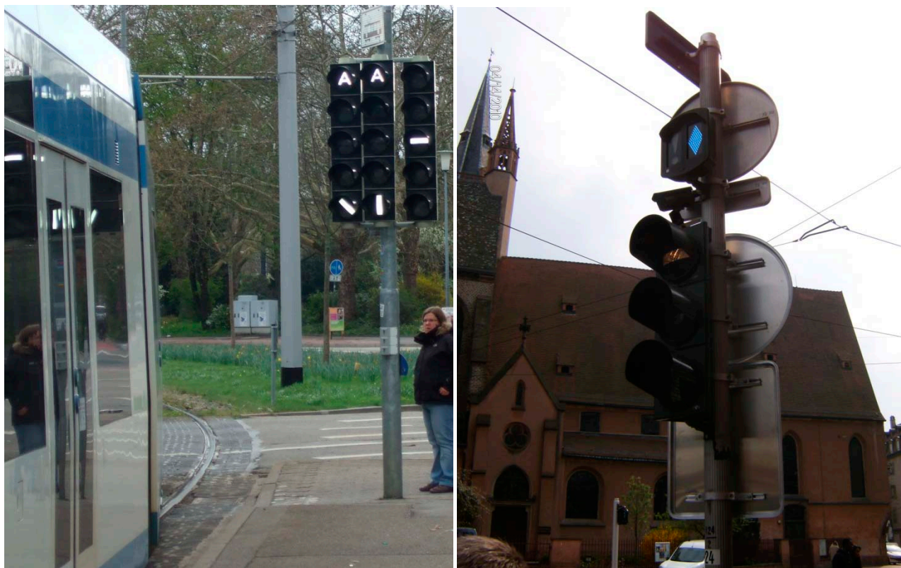
Figur A5 Lyssignaler i Heidelberg (venstre) og Strasbourg (højre).