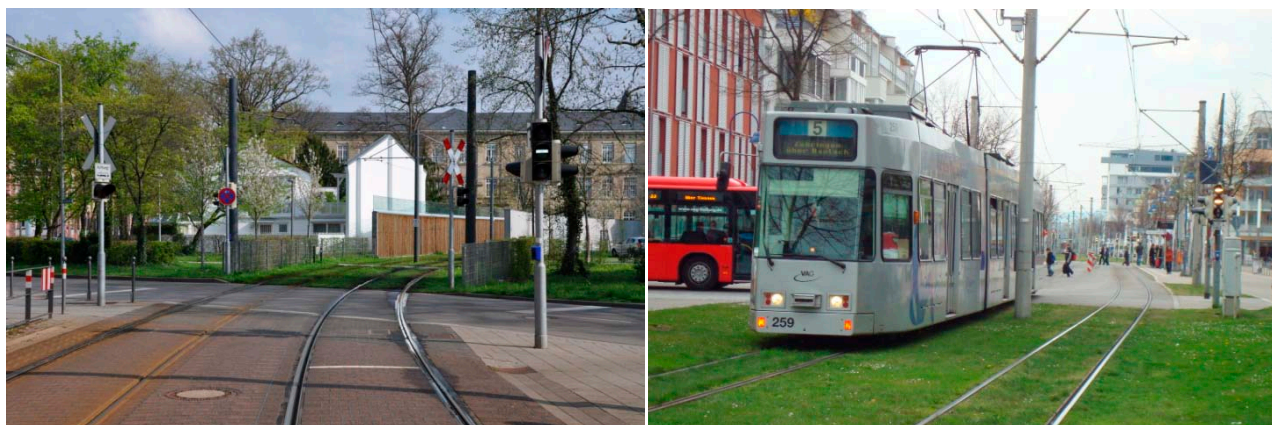
Figur A4 To eksempler på en typisk placering af signalstandere for letbanen i forbindelse med en krydsende trafikvej. Til venstre fra Karlsruhe og til højre fra Freiburg.