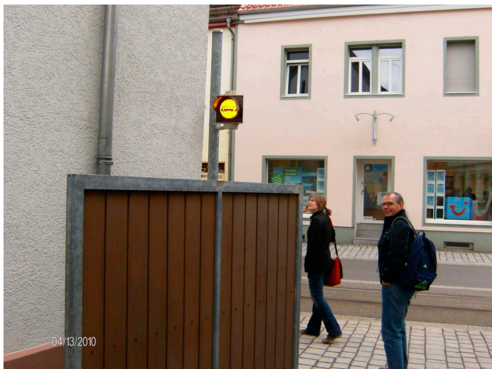
Figur B2 Et advarselssignal ved en indkørsel ud til letbanetracéet i Kirchheim, som ligeledes aktiveres af letbanetog inden passage forbi indkørslen.