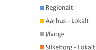
Figur 1: Fordelingen af lokale og regionale rejser for rute 112.