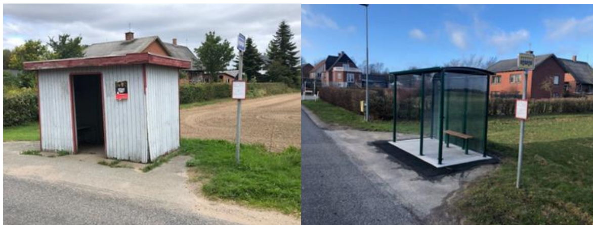
Figur 1: Før og efter billeder af stoppestedprojekt i Skive Kommune

De første projekter er nu afsluttet. Bl.a. har Norddjurs Kommune moderniseret cykelparkeringen ved letbanestationerne i Trust, Grenå og Hessel. Mens Skive Kommune har udskiftet i alt seks læhuse.